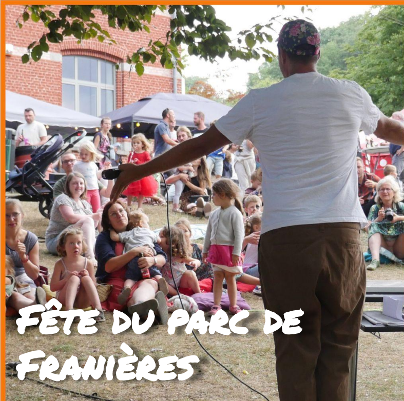
FÊTE DU PARC DE FRANIÈRES